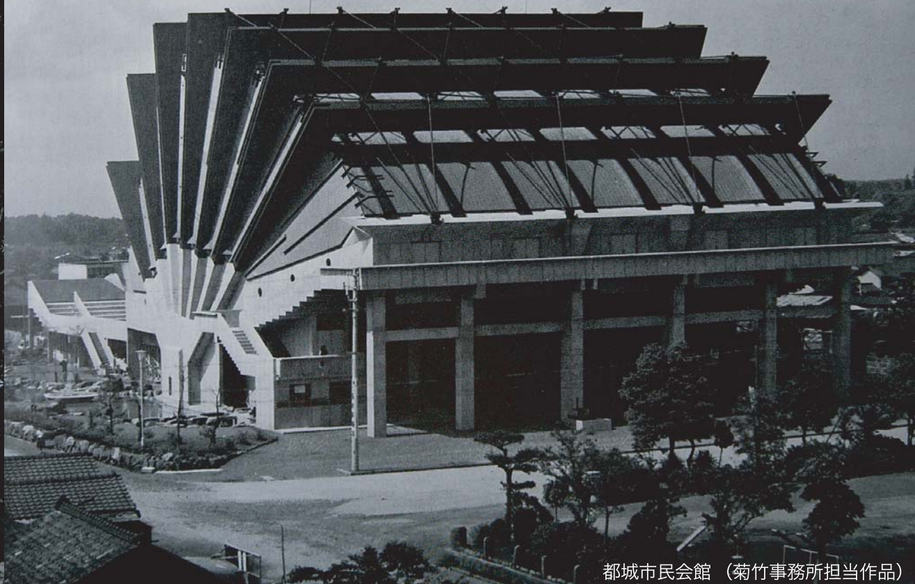
都城市民会館 (菊竹事務所担当作品)