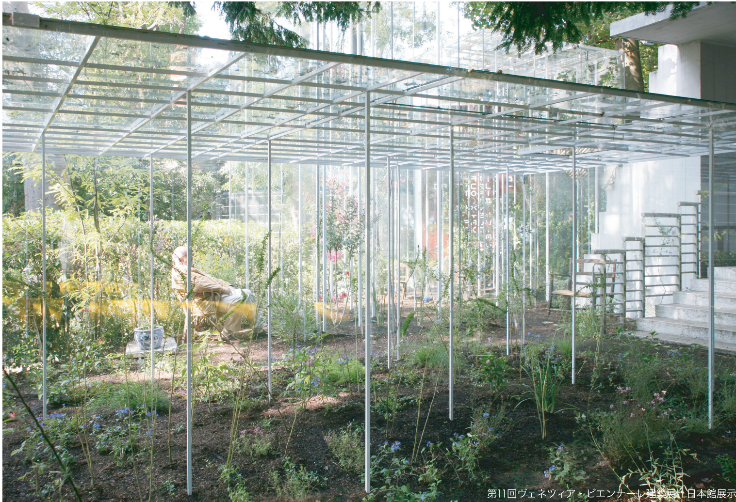
第11回ヴェネツィア・ビエンナーレ建築展「日本館」展示